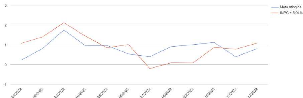
Gráfico - Rentabilidade x Meta (mês a mês)

Nossa distribuição por benchmark encerra: